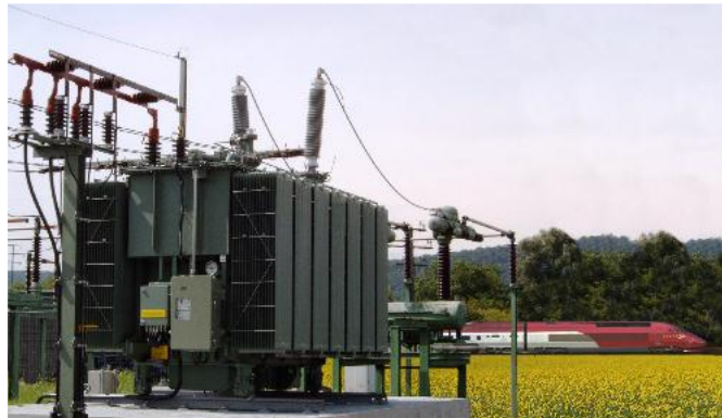
15 MVA 120/17,25 kV 16,7 Hz Hermetiktransformatoren für Bahnstrom-Unterwerke

Im letzten Jahrzehnt hat ein deutscher Bahnbetreiber eine große Serie hermetisch verschlossener grüner Transformatoren für 10 und 15 MVA mit patentierten Dehnradiatoren und Vakuum-Stufenschalter für einen geringeren Wartungsaufwand, eine höhere Überlastbarkeit und eine längere Lebensdauer eingesetzt.