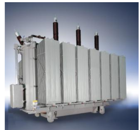
Grüner Leistungstransformator 110 kV, 31,5 MVA