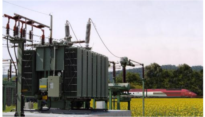
Transformateur hermétique 15 MVA 120/17,25 kV 16,7 Hz pour applications ferroviaires

Dans la dernière décennie, une entreprise ferroviaire Allemande a acquis des transformateurs de puissance écologiques (10 et 15MVA) équipés des radiateurs expansibles et des changeurs de prises au vide. Le but étant d'avoir des coûts de maintenance réduits, des capacités de surcharges optimisées and une durée de vie rallongée.