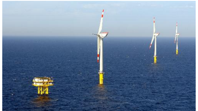
Transformateur hermétique 75 MVA 115/31 kV avec changeur ampoule à vide et système de monitoring MS3000 pour la ferme éolienne off-shore Alpha Ventus en service depuis 2008

Pour plus d'informations, veuillez contacter : GE Energy Connections Grid Solutions